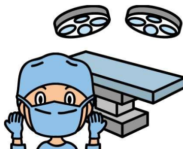
手術や放射線治療にも