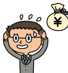
復職後の所得の減少にも