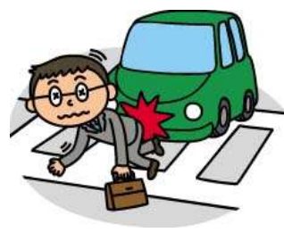
交通事故の後遺障害で 長期の就業障害に